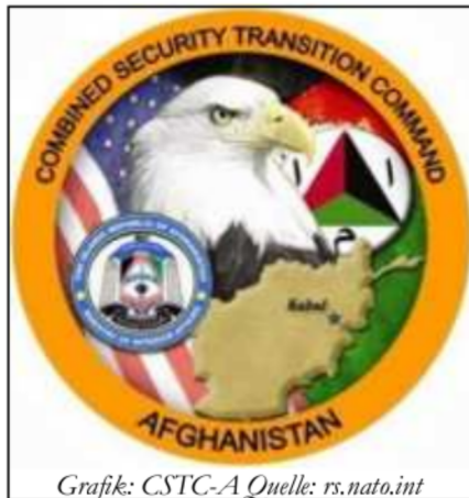
Grafik: CSTC-A Quelle: rs.nato.int

Die Modellberechnungen ergaben, dass der zu erwartende Patientenanstieg mit den zu Verfügung stehenden sanitätsdienstlichen Kapazitäten nicht zu bewerkstelligen sein wür-