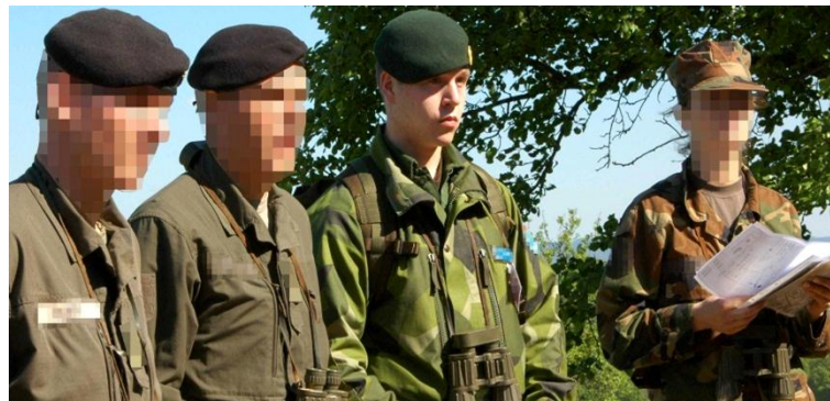
Abbildung 1: Nationale und internationale Berufsoffiziersanwärter beim Führungstraining Crisis Management Operations. 3

Grundsätzlich dienen Bilder, Grafiken und Tabellen der Unterstützung des Textes und